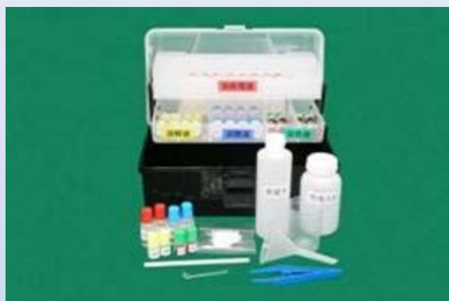
(アスベストワーカー プロ)